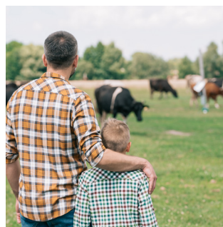
Agricultura, ganadería y forestal

En esta edición se priorizarán los proyectos e ideas relacionadas con alguno de estos sectores productivos: