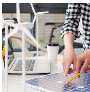
Energía, medio ambiente y movilidad